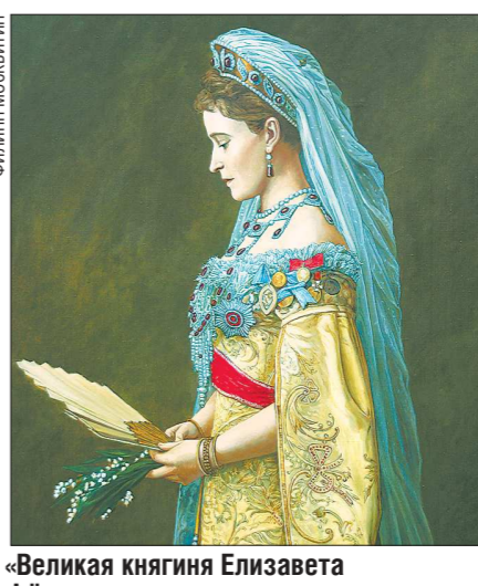
«Великая княгиня Елизавета Фёдоровна»