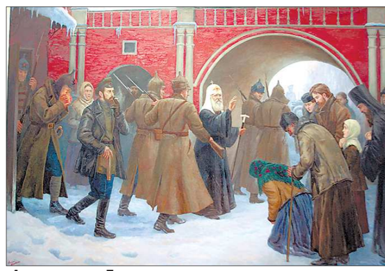
«Арест патриарха Тихона»