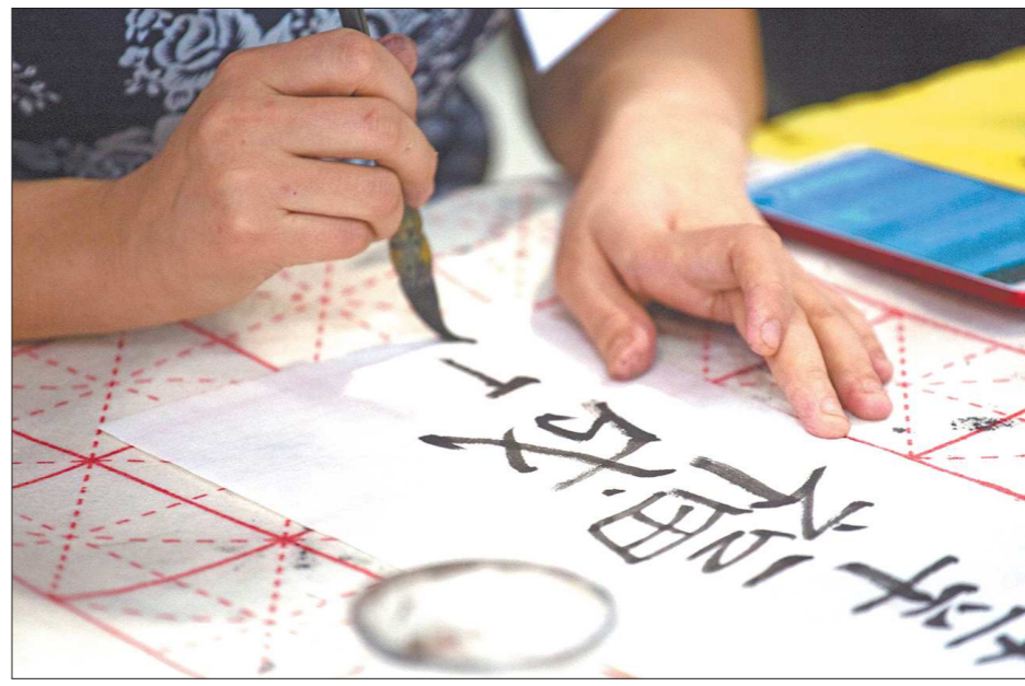
Гостей ждали мастер-классы, на одном из них можно было написать своё имя иероглифами

А ещё в перерывах между выступлениями можно было попробовать китайские пирожные, научиться писать своё имя на китайском языке и правильно заваривать чай, смастерить оберег и сделать селфи с ростовой куклой в виде огромной панды.