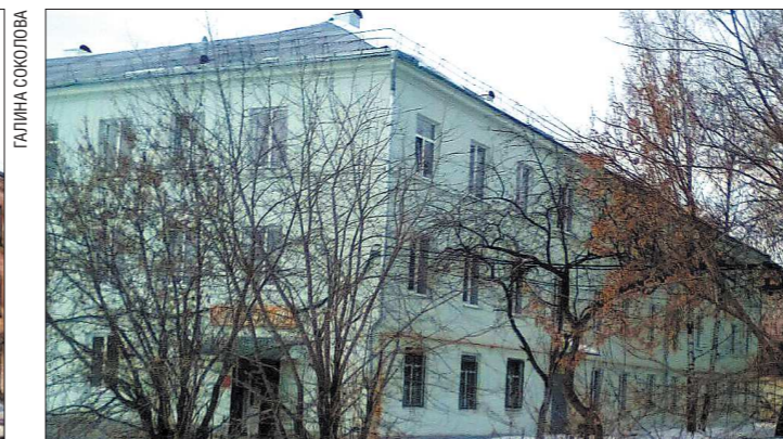
Эти два бывших общежития расположены в Кушве по соседству, год назад они и выглядели одинаково. Теперь жители на Гвардейцев, 12 отчаянно завидуют жителям на Гвардейцев, 10, но некоторые обитатели обновлённого дома вновь превращают его в коммунальное гетто