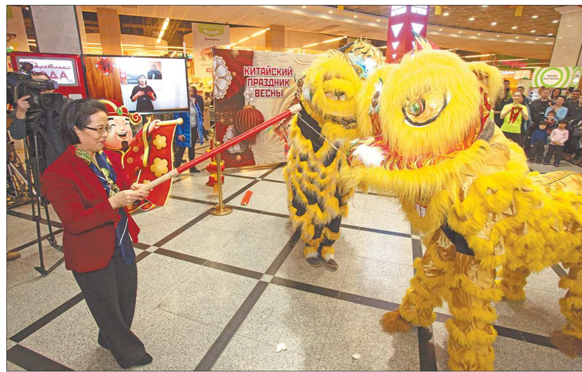
По доброй традиции почётным гостям праздника предложили задробрить сказочных существ, покормив их. Это делается для того, чтобы год был удачным