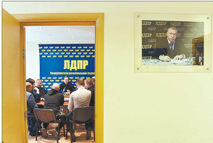
В реготделении ЛДПР мы попали на заседание штаба