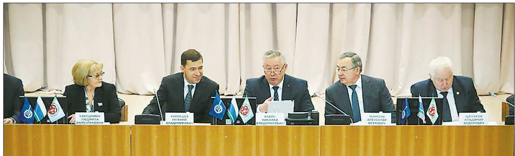
Областные власти намерены отстаивать интересы ОПК области и в части выпуска военной продукции