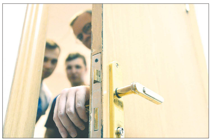
За дверь «резиновой» квартиры могут быть прописаны тысячи человек

Напомним, история о небывалом для столицы Урала количестве зарегистрированных в одной квартире приезжих из сопредельных государств была обнаружена прокуратурой Екатеринбурга Светланой Кузнецовой на заседании гордумы, где она раскритиковала работу полиции областного центра («ОГ» писала об этом в номере за 22 марта 2018 года). Пикантность ситуации заключается в том, что рост количества зарегистрированных в одной квартире иностранцев произошёл в период, когда в отношении хозяина жилья было возбуждено уголовное дело за фиктивную прописку.