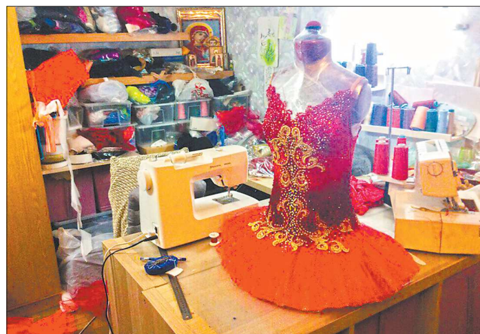
Знаменитая пачка Алины Загитовой в работе

рукава и зафиксирована под воротником, а воротник тоже зафиксирован застёжками. Даже если очень захотеть, случайно не расстегнуть. Но самое главное — молнии не видно.