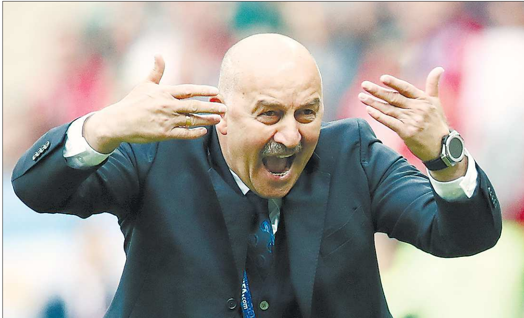
Главный тренер сборной России по футболу Станислав Черчесов, кажется, никак не мог поверить в победу с таким счётом. Но он действительно сделал всё для этого исторического результата

На легендарной арене «Лужники», которая была реконструирована специально для чемпионата мира, в день матча последние приготовления велись с самого утра. Волонтеры, службы охраны, организаторы – все готовились к приёму матча-открытия чемпионата мира. Выполнялись и