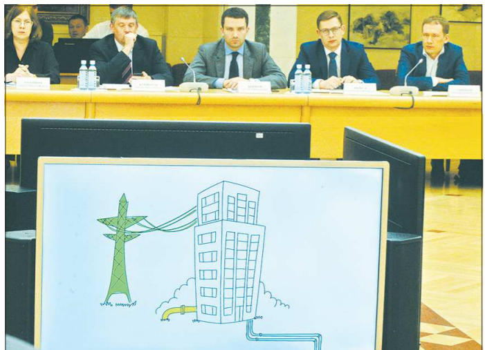
Тестирующие работу единого портала пользователи отметили его удобство и простоту

Вопросы технологического присоединения к инженерным сетям всегда вызывали высокий интерес бизнеса, поскольку от этого напрямую зависят сроки реализации инвестиционных проектов.