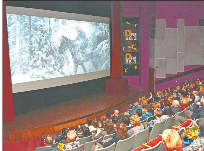
Зрителей всё больше привлекает отечественное кино, но до показателей Голливуда всё равно ещё далеко

Более того, отечественное кино остаётся драйвером рынка кинопроката в целом и значительно опережает иностранный контент по количеству зрителей (на 23,7 млн зри-