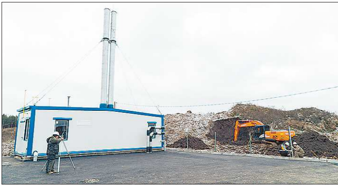
Наличие инфраструктуры - ключевое преимущество индустриального парка, которое может заинтересовать инвесторов