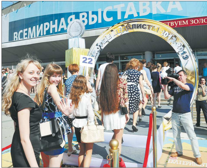
Чествование медалистов в Свердловской области всегда проходит ярко. Но отныне получить высшую награду за учёбу в школе будет сложнее, чем прежде

Надо сказать, что медаль приобретает в разных вузах страны от трёх до 10 баллов к сумме ЕГЭ. Вроде бы не так много. Но когда поступление на грани, именно они становятся решающими: при равных баллах преимущество вуз отдаёт именно отличнику учёбы. Так что за медаль горой стоят и дети, и родители, да и сами учителя. Если поступать в вузы у выпускников высокая, это вли-