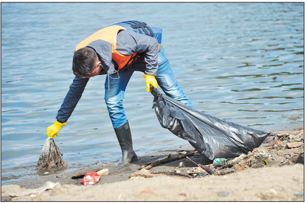
Есть волонтеры, которые проводят разовые акции. Но больше пользы для природы, когда они постоянно контролируют чистоту пруда, например. В этом случае Центр поддержки гражданских инициатив поможет волонтерам в работе

В середине августа на форуме «Машук 2018» секретарь генсовета «ЕР» Андрей Турчак заявил, что идея по созданию механизма поддержки общественных инициатив пришла «снизу» — от активистов на местах. Предполагается, что проект будет работать по нескольким ключевым направлениям; в их числе — поддержка социально значимых гражданских инициатив и проектов НКО, патриотических проектов, новых средств массовой информации и непосредственно журналистов. Не забудут и приоритетные для провинции вопросы внутреннего туризма, развития территорий, IT, социального предпринимательства, долголетия граждан и культурной сферы. Центр окажет активистам помощь в организации важных для общества дел, экспертную поддержку и даже поможет составлять заявки на гранты. При этом о материальной поддержке со стороны самого центра речь пока не идёт. Планируется, что в каждом регионе появятся наблюдательные советы, куда пригласят представителей общественности, политики и бизнеса. По словам депутата Госу-