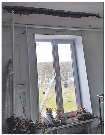
Последствия землетрясения в городской больнице Катав-Ивановска

Вчера ранним утром, в 3:58, в районе города Катав-Ивановск Челябинской области произошло землетрясение, которое сейсмологи назвали самым крупным на Урале за последние сто лет.