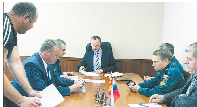
Комиссия по чрезвычайным ситуациям в Катав-Ивановске. В ней участвуют группа ГУ МЧС РФ по Челябинской области, руководство муниципалитета, депутаты, оперативные дежурные