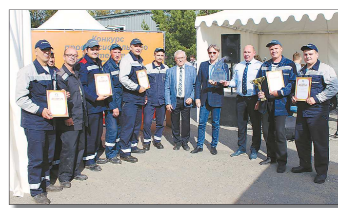
нужно было устранить утечку газа, произошедшую на ШРП (шкафной регуляторный пункт), после чего настроить работу регулятора давления газа.

31 августа 2018 года на спецполигоне в Нижнем Тагиле состоялся финал конкурса профессионального мастерства среди коллективов газовых хозяйств Свердловской области.