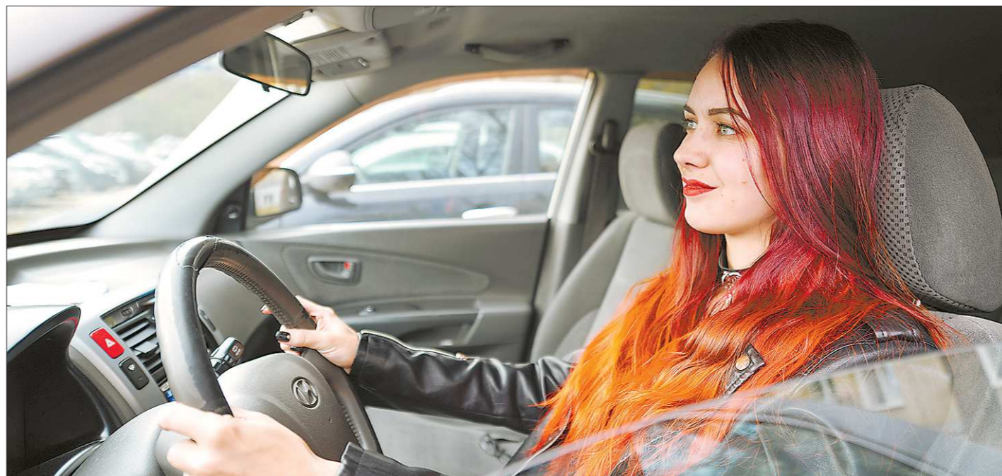
Актуальную информацию о ситуации на дорогах водители теперь узнают по радио

Получить консультацию о сумме имущественных налогов (за квартиру, жилой дом, земельный участок, автомобиль) и порядке их исчисления можно в ходе Дней открытия всех налоговых инспекций страны 9 и 10 ноября 2018 года. В рамках мероприятия всем желающим расскажут также о действующих в регионе ставках и льготах, ответят на другие вопросы по теме налогообложения имущества. Все желающие смогут подключиться к интернет-сервису «Личный кабинет налогоплательщика для физических лиц», а посетителям, которые не получили по каким-либо причинам налоговое уведомление, специалисты УФНС выдают копию неполученного уведомления с расчётом суммы платежа за каждое подлежащее налогообложению объекту и квитанцией на уплату, которые в адрес свердловчан были направлены ещё в июле текущего года.