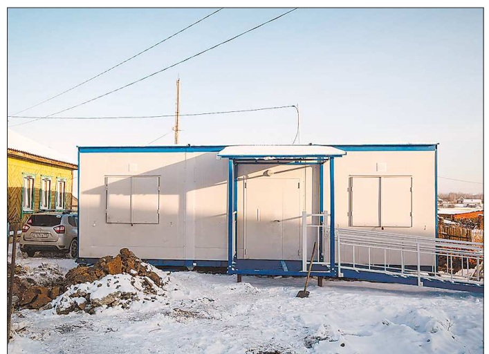
ФАП в Кокшаровой анфас

И сегодня совершенно очевидно, что проект расширения метрополитена силами только муниципальной власти не реализовать. Значит, нужно искать выходы на федеральный уровень, чтобы мечта уральцев наконец-то исполнилась.