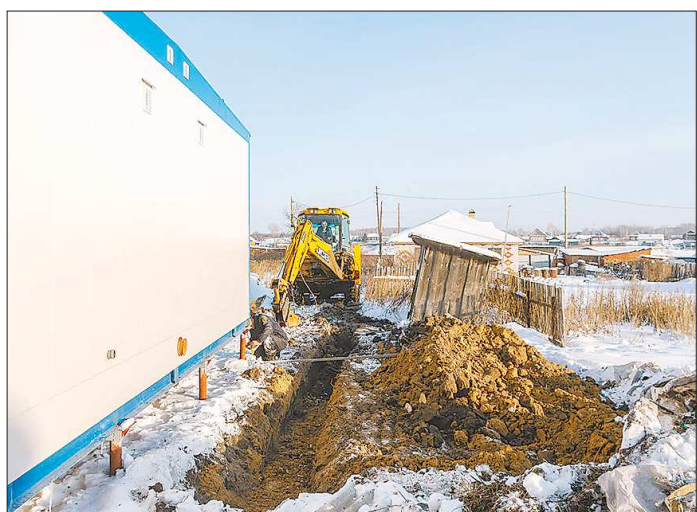
Тот же ФАП, вид сзади