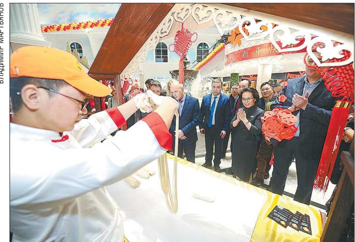
Гости узнали секреты приготовления китайской лапши ипельменей