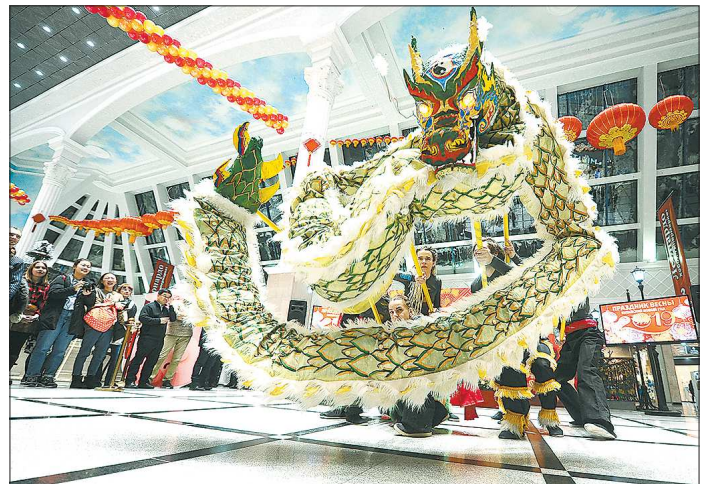
Дракон символизирует в Китае силу и достоинство