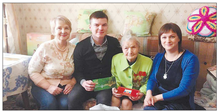
Со столетием пенсионерку из Екатеринбурга поздравили близкие и сослуживцы