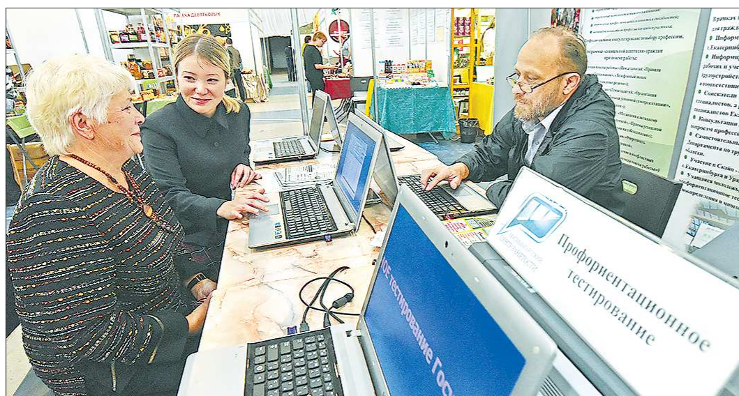
Почти каждый восьмой безработный в Свердловской области — предпенсионного возраста

— Как присваивается статус гражданина предпенсионного возраста?