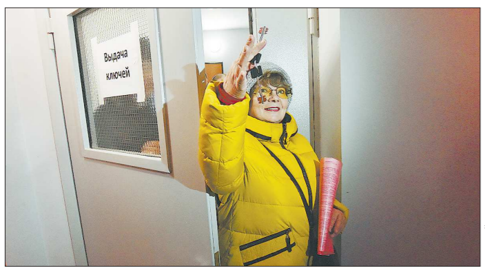
Один из проблемных объектов долевого строительства в Арамиле сдали в прошлом году. Застройщик также был найден благодаря работе специальной координационной комиссии

8 февраля на сайте www.pravo.gov66.ru официально опубликованы Распоряжение Правительства Свердловской области от 08.02.2019 № 45-ПР «О проведении в Свердловской области Всероссийского форума отцов «Роль отца в современной семье: государственная политика и новые перспективы» (номер опубликования 20319). Распоряжение Аппарата Губернатора Свердловской области и Правительства Свердловской области от 07.02.2019 № 4-РА «Об утверждении Положения об общественных советниках Заместителя Губернатора Свердловской области – Руководителя Аппарата Губернатора Свердловской области и Правительства Свердловской области» (номер опубликования 20320).