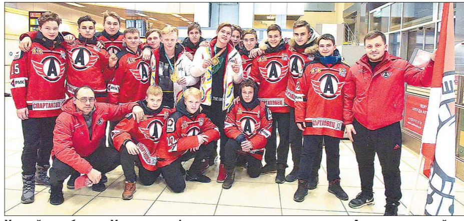
Хоккейная сборная Уральского федерального округа - чемпион Азии среди детей