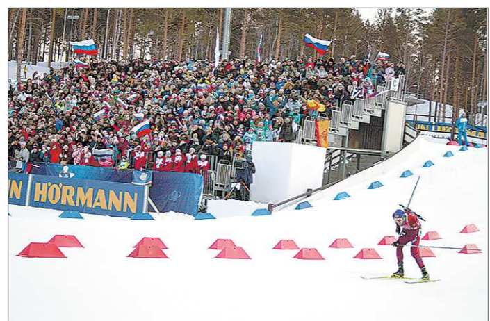
Биатлон по-прежнему является одним из самых медийных зимних видов спорта в России. Но надолго ли?

Сейчас всё по-другому, поэтому что, как мы уже неоднократно писали, СБР не позавидовал о визаж для спортсменов, поэтому в североамериканских этапах Кубка мира (которые должны были стать важнейшей частью подготовки к Эстерсунде и поводом для определения окончательного состава) принимали участие те российские спортсмены, у которых визы были. Те, у кого их не было, отправились в Италию на тренировочный сбор. Конечно, тем кто не попал в США и Канаду, необходима соревновательная практика, да и тренерскому штабу нужно оценить готовность тех или иных спортсменов. Именно поэтому мы бросаем всех в бой в Белоруссии, когда все ведущие спортсмены мира восстанавливаются и готовятся к чемпионату мира. Пока остаётся загадкой, для чего в Минск вызвали Александра Логинова. Лидер муж-