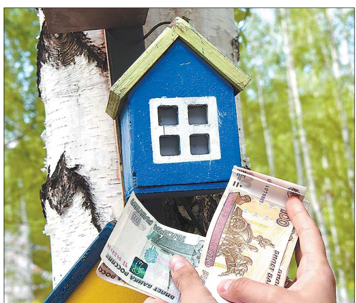
Каждый мечтает купить жильё дешёво. Но чем демократичнее цена, тем более бдительным надо быть

Некоторые предостерегают сомнения потенциальных покупателей и заранее объясняют, почему цена на жильё такая невысокая. «Значительно дешевле рынка. Заложностей и обременений нет. Продаётся за ненадобностью» - объясняет хозяин однушки в Буланаше стоимостью в 150 тысяч рублей. Но осторожность при покупке такого жилья всё-таки не повредит.