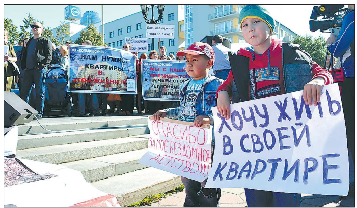
Пострадавшие от недобросовестных застройщиков - это не только обманутые дольщики