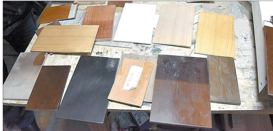
В отличие от пластикового деревянное окно можно покрасить в любой цвет