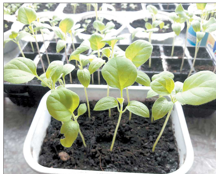
После того как у рассады баклажанов появятся первые листья, ростки необходимо распикировать