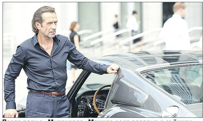
После роли в «Миллиарде» Машков взял перерыв в съёмках

Начало апреля, а также май богат кинематографическими премьерями. «ОГ» разбирается с главными отечественными картинами на ближайшие месяцы весны.