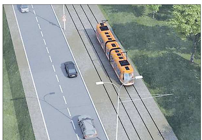
Администрация Верхней Пышмы