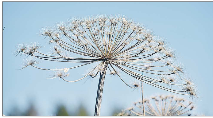
Засохший борщевик уже не опасен, но тысячи семян, которые разнесло ветром, дадут всходы