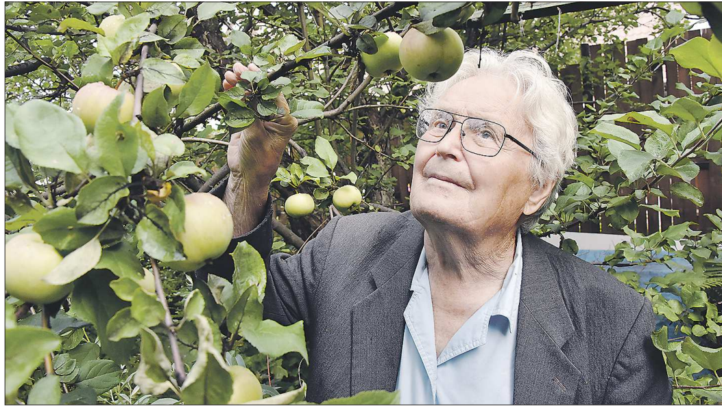
У Леонида Котова – 33 авторских свидетельства на сорта яблони и груши

Уральских садоводов закрепило понятие – котовские сорта яблони, это значит зимостойкие, дающие качественные плоды, обильный урожай. Своего рода знак качества. Известный российский селекционер Леонид Котов – автор великодушных сортов яблони и груши, которые в суровых условиях Урала дают отличный урожай и растут во многих других регионах страны. В свои 90 лет мэтр отечественного садоводства продолжает преподавать и трудиться на Свердловской селекционной станции садоводства.