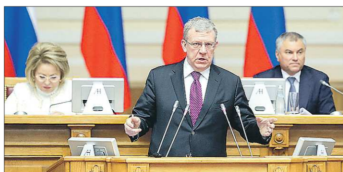
ПРЕДСЕДТЕЛЯ СЧЕТНОЙ ПАЛАТЫ РФ

По словам Алексея Кудрина, создание метрополии необходимо для того, чтобы «уравновесить развитие страны»