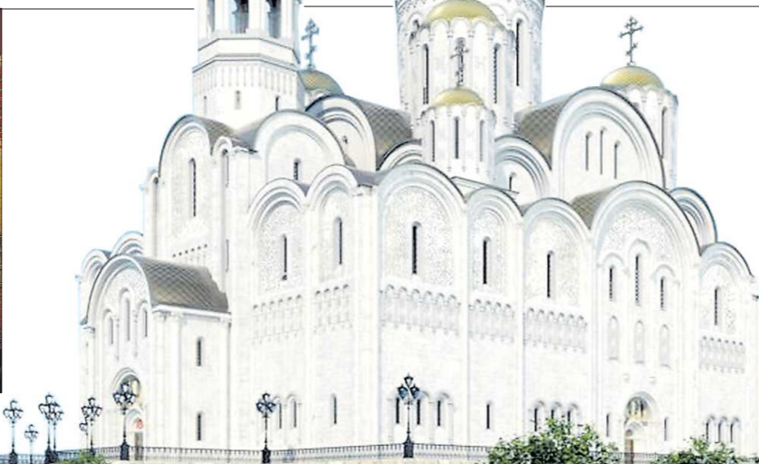
ПРЕДСЕДТЕЛЯ ОБОИДЫ ПАМЯТНИКА НА КРОВИ

Да, утраченный собор Святой Екатерины был выполнен в стиле барокко. Конечно, если бы мы восстанавливали храм на его историческом месте, тогда да, стоило бы воссоздать, насколько возможно, его исконный облик.