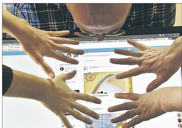
Разработчики закона о Рунете уверены, что он позволит сохранить связь в России и возможность пользоваться привычными сервисами