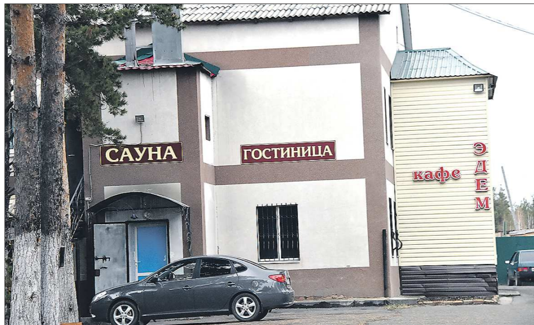
С услугами общепита в наших туристических центрах более-менее нормально, чего не скажешь о сфере гостеприимства

Каждый год в начале августа проходит Ирбитская ярмарка, на которую приезжают тысячи туристов. Ещё один центр притяжения для путешественников – Ирбитский государственный музей мотоциклов, основой экспозиции которого стала коллекция мототехники Ирбитского мотоциклетного завода. Важно отметить, что музей специализируется на тяжёлых мотоциклах – именно такие выпускали и продолжают