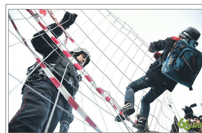
Мать посадила ребёнка на забор, не думая о его здоровье

На центральной усадьбе природного парка можно разместить лишь 20 человек. И это даже не гостиница, а комнаты отдыха, стоить это будет от 1 200 рублей за комнату. Кто-то находит уют на турбазе в селе Аракаево, у частных в посёлке Бажуково, но большинство – в гостиничном комплексе в посёлке Новая Ельня, расположенном в 4 километрах от Оленей Ручьёв. Там ночлег обойдётся от 2 до 3,5 тысячи рублей. При этом в год Оленьи Ручьи посещают до 80 тысяч человек, а в один из дней прошлой осени приехали почти 3,5 тысячи. Но с ночёвкой они не остались – негде было.