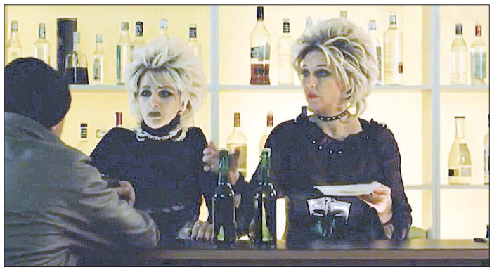
Фильм «Борис Годунов», снятый Владимиром Мирзоевым в 2011 году, повторяет сюжет Пушкина в современных реалиях