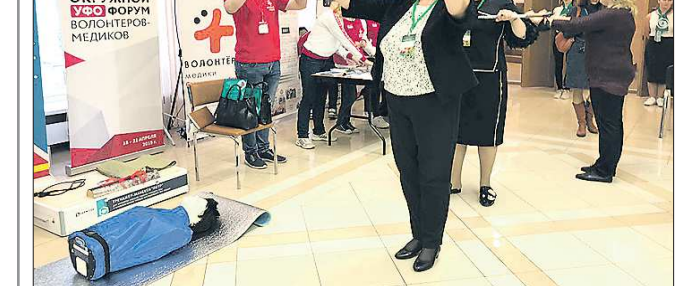
В Екатеринбурге проходит XI Уральский конгресс по здоровому образу жизни...