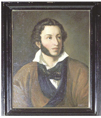
Ко времени создания этого портрета в 1827 году Пушкин уже написал «Бориса Годунова»