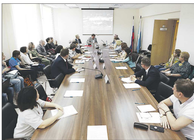
Мы знаем, город будет. А вот каким – зависит от каждого из нас

Повестка заседания Общественной палаты Свердловской области звучала так: «О недостатках сложившейся практики проведения общественных обсуждений и публичных слушаний по вопросам архитектуры и градостроительства».