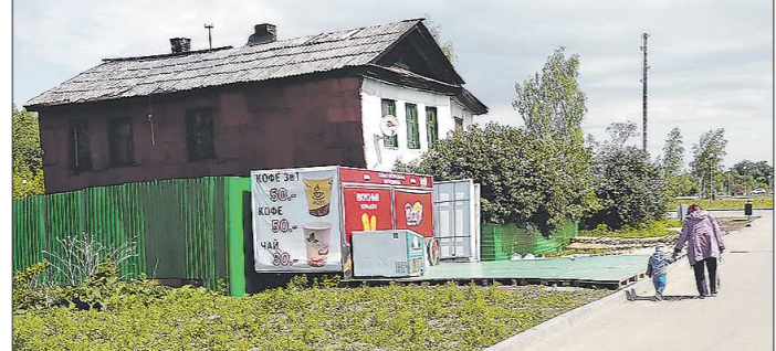
На днях возле дома появился киоск предприниматель объяснил, что арендовал эту землю. На продавца составлен административный протокол за торговлю в не отведённых для этого местах

Парк «Народный» в марте прошлого года стал лидером голосования за комфортную городскую среду в Нижнем Тагиле. Сегодня благоустроенная территория на берегу реки Тагил – это популярное место отдыха.