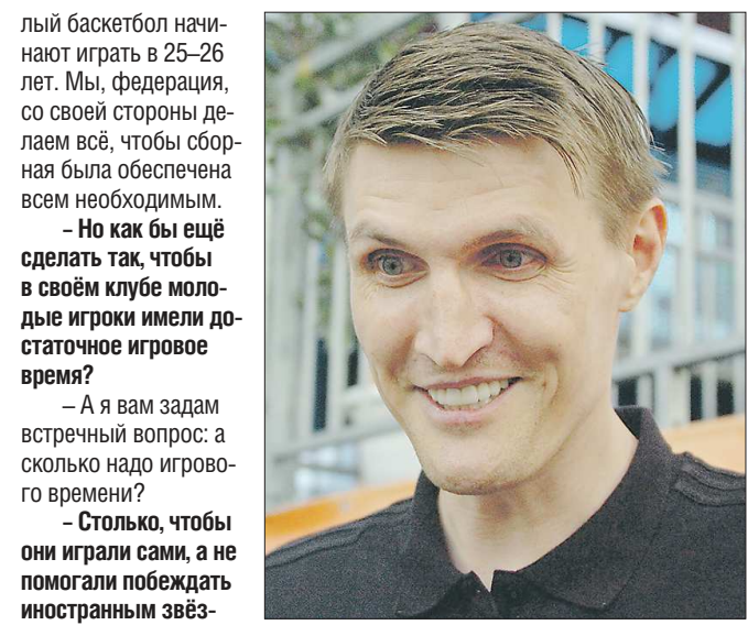
Оптимизму президента РФБ Андрея Кириленко можно только позавидовать

– Вы же видите, что в сборной сейчас очень большой разрыв. Есть игроки 30 лет и старше, а есть 23 и младше. Суперпоколение, девочки, которые два года назад победили на чемпионате мира до 19 лет. Да, нам очень хочется, чтобы они уже сейчас выстрелили, но это невозможно. Во взрос-