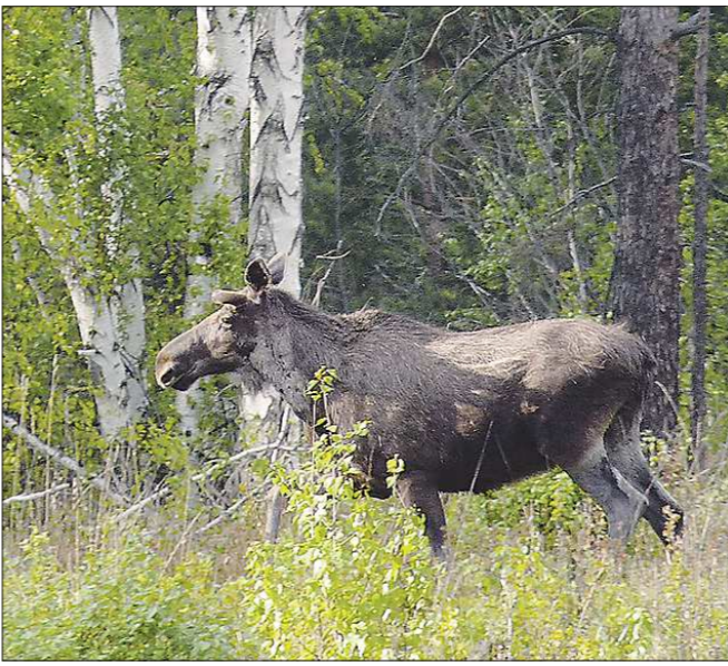
Лось в любой момент может выскочить на дорогу