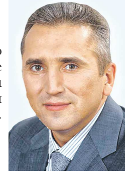
Александр МООР, губернатор Тюменской области

Важна совместная координация деятельности субъектов РФ в планировании социально-экономического развития. Необходимо выработать единые подходы и методы, общие предложения, которые будут положены в основу стратегии дальнейшего развития Урало-Сибирского макрорегиона.