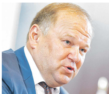
Николай ЦУКАНОВ, полномочный представитель президента РФ в Уральском федеральном округе

ЗДРАВООХРАНЕНИЕ КУЛЬТУРА ОБРАЗОВАНИЕ ДЕМОГРАФИЯ БЕЗОПАСНЫЕ И КАЧЕСТВЕННЫЕ АВТОМОБИЛЬНЫЕ ДОРОГИ ЖИЛЬЕ И ГОРОДСКАЯ СРЕДА ЭКОЛОГИЯ НАУКА ЦИФРОВАЯ ЭКОНОМИКА ПРОИЗВОДИТЕЛЬНОСТЬ ТРУДА И ПОДДЕРЖКА ЗАНЯТОСТИ МАЛОЕ И СРЕДНЕЕ ПРЕДПРИНИМАТЕЛЬСТВО И ПОДДЕРЖКА ИНДИВИДУАЛЬНОЙ ПРЕДПРИНИМАТЕЛЬСКОЙ ИНИЦИАТИВЫ МЕЖДУНАРОДНАЯ КООПЕРАЦИЯ И ЭКСПОРТ КОМПЛЕКСНЫЙ ПЛАН МОДЕРНИЗАЦИИ И РАСШИРЕНИЯ МАГИСТРАЛЬНОЙ ИНФРАСТРУКТУРЫ