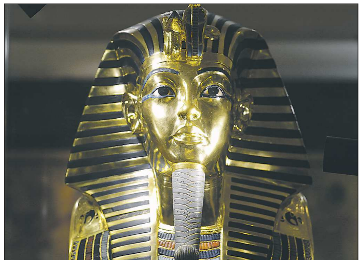
Знаменитая маска Тутанхамона. Её вес – практически 11 килограммов. Её изображение украшает реверс монеты достоинством в 1 египетский фунт

Выставка продлится до 10 ноября 2019 года.