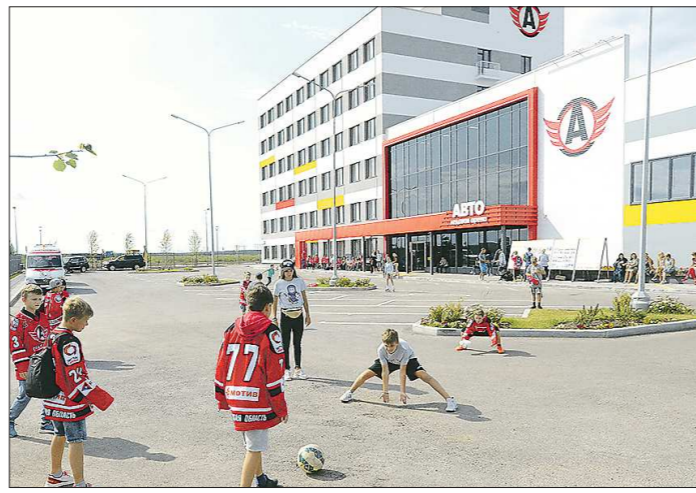
Это уже не макет, где всегда всё красиво, а реальный спорткомплекс