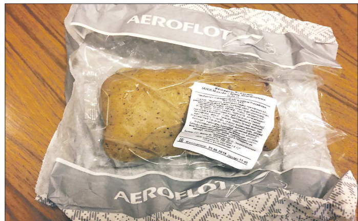
«Аэрофлот» на рейсах в Москву и Санкт-Петербург из Екатеринбурга питание не отменил: пассажир получает сэндвич, яблоко и йогурт

Российские авиакомпании продолжают отменять питание на коротких рейсах.