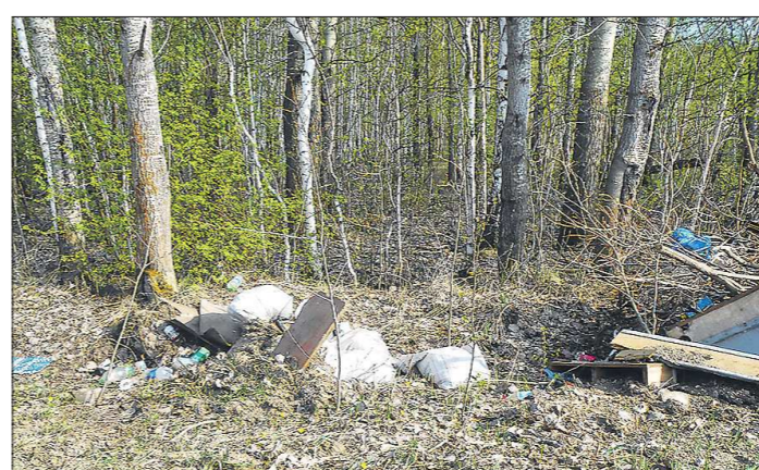
В этом году мусор из лесов Среднего Урала будут убирать около 700 тысяч жителей региона

от получить питание, то ему приходится доплачивать к стоимости билета от 500 рублей. Сегодня в России, по мнению Марамыгина, есть только три лидера среди авиаперевозчиков: «Аэрофлот», S7 и «Уральские авиалинии».