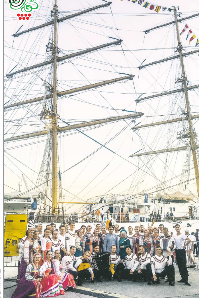
Уральский народный хор вернулся в Екатеринбург после большого гастрольного тура по Крыму.

За 16 дней гастрольного тура артисты Уральского народного хора дали