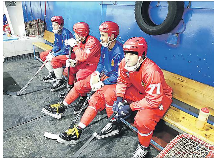
На улице остатки уральского лета, а под крышей КСК хоккеисты «Трубника» уже в родной стихии

«Уральский трубник» в эти дни проводит предсезонный сбор в Новоуральске, на базе местного концертно-спортивного комплекса. Сезон первоуральской команды предстоит ответственный — необходимо доказать себе, болельщикам и соперникам, что прошлогодняя бронза чемпионата России это не случайность, а свидетельство выхода клуба на новый уровень.