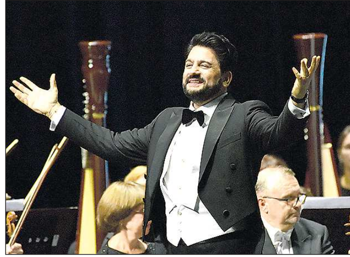
Юсиф Эйвазов наслаждался происходящим

гресс-центра – один из лучших в России и в мире. Уверен, он достоин быть главной сценой для выступления выдающихся артистов и творческих коллективов.