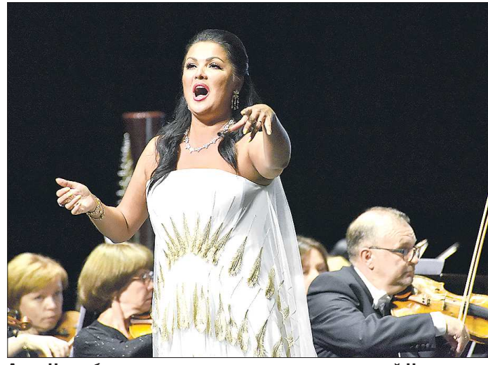
Анна Нетребко исполнила отрывки из произведений Чиле, Пуччини, Верди, Легара, Ардити, Дворжака и Кальмана

– Это зримое олицетворение огромного потенциала Свердловской области и нашего постоянного стремления к созидательному процессу.