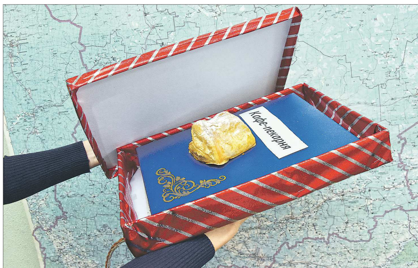
Уральский центр франчайзинга оказывает помощь и тем, кто хочет упаковать свой бизнес по франшизе, и тем, кто хочет приобрести франшизу

Как выглядит этот процесс? Центр изучает финансовую устойчивость