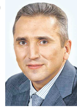
Александр МООР, губернатор Тюменской области

на открытии VII бизнес-форума «День знаний для предпринимателей» 11 сентября