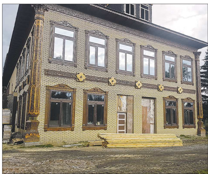
Здания лагерьной инфраструктуры реконструировали и отстроили заново

– Была задумка построить оздоровительный комплекс для спортивных команд и обычных жителей